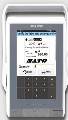
Vorschau überprüfen und Menge eingeben